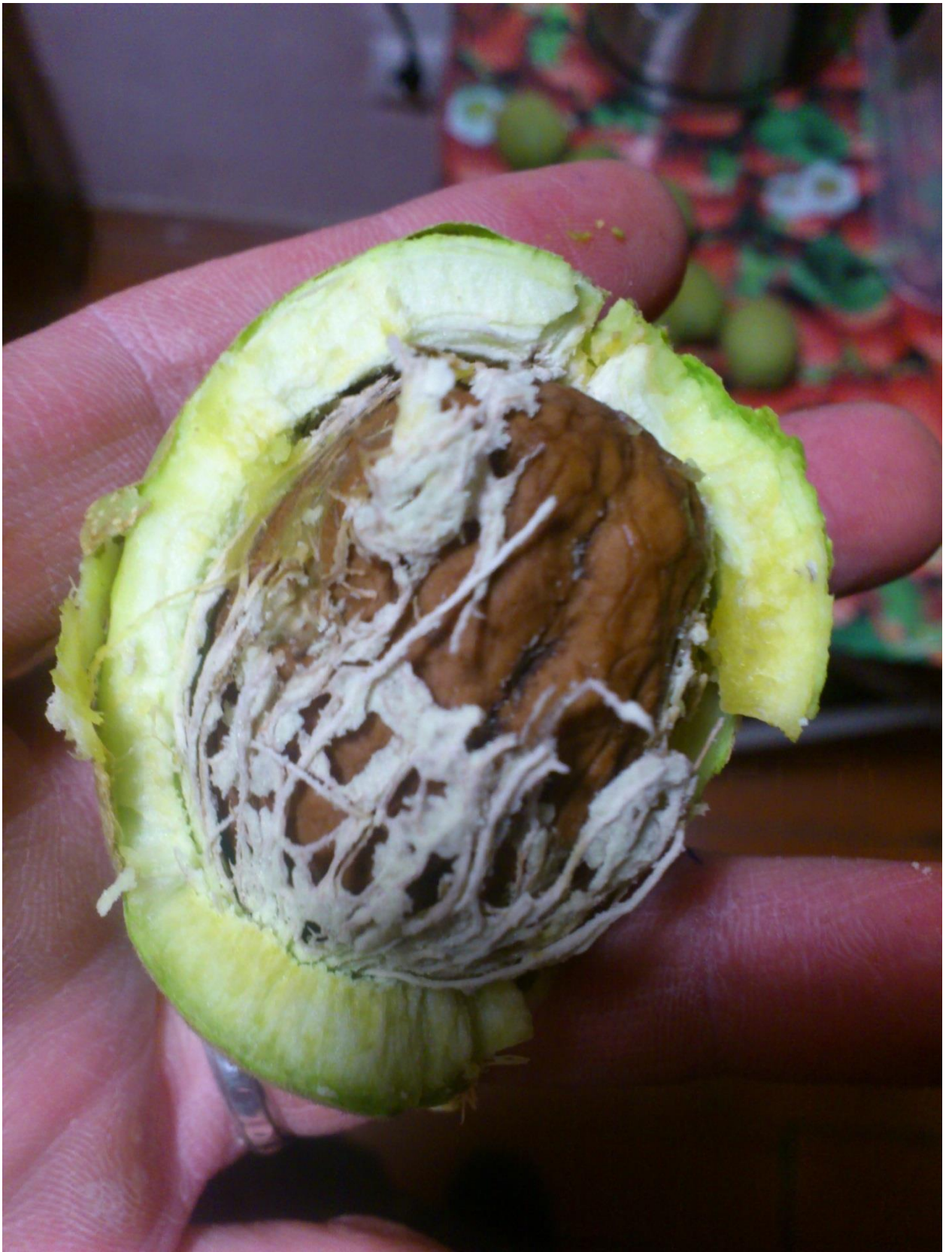
И, наконец-то, желанный плод: