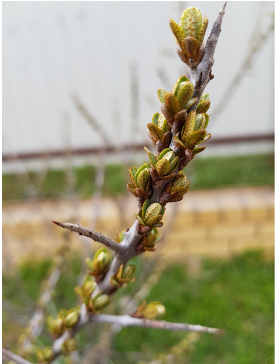
У ежевики распускаются листики