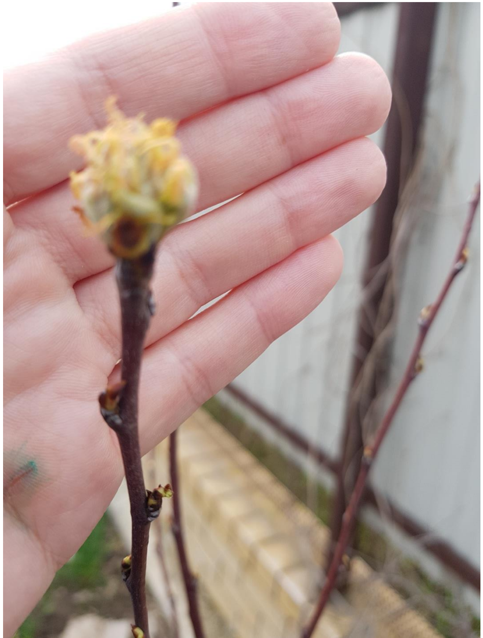
А это почки инжира