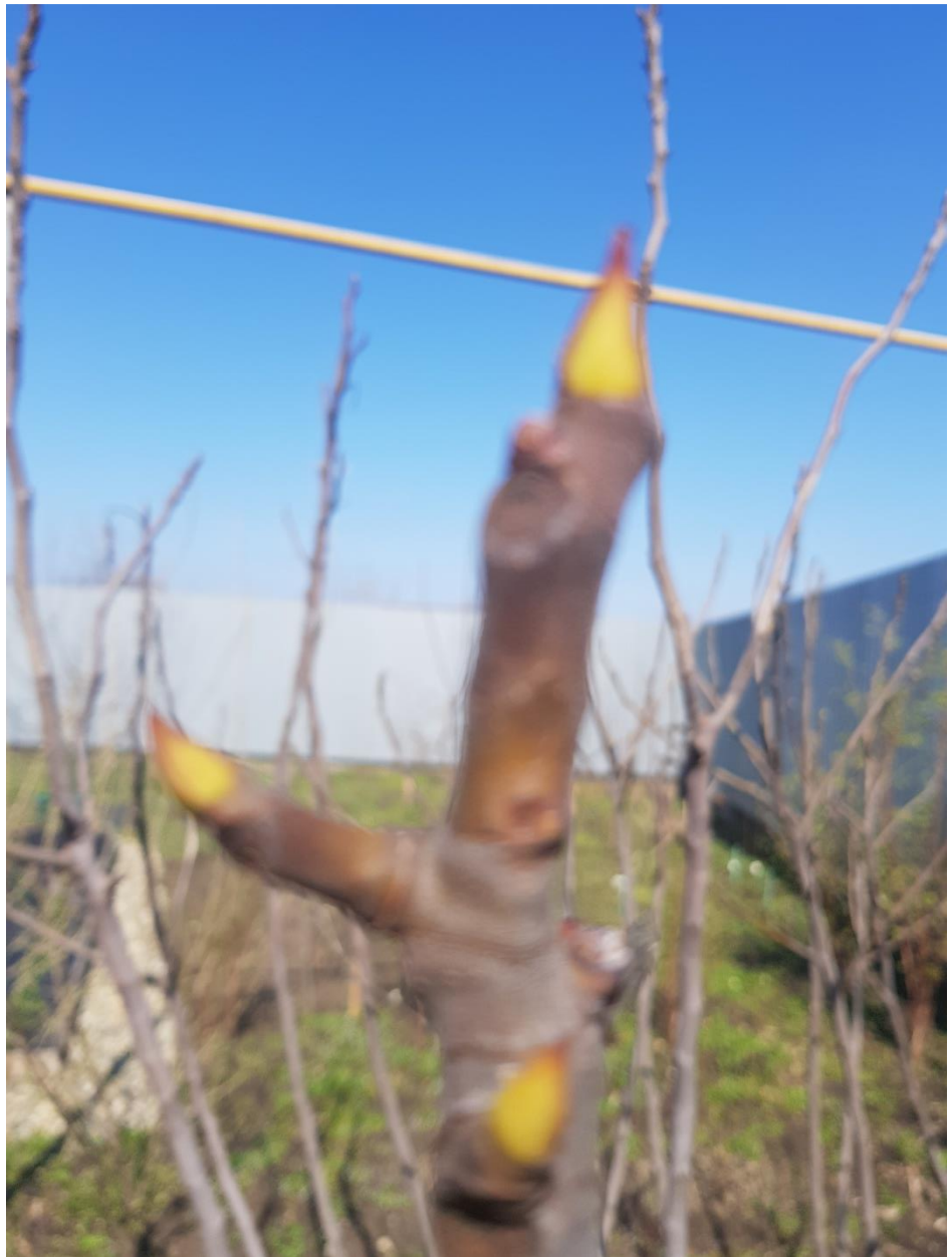
Жимолость распустила уже листики и зацветает