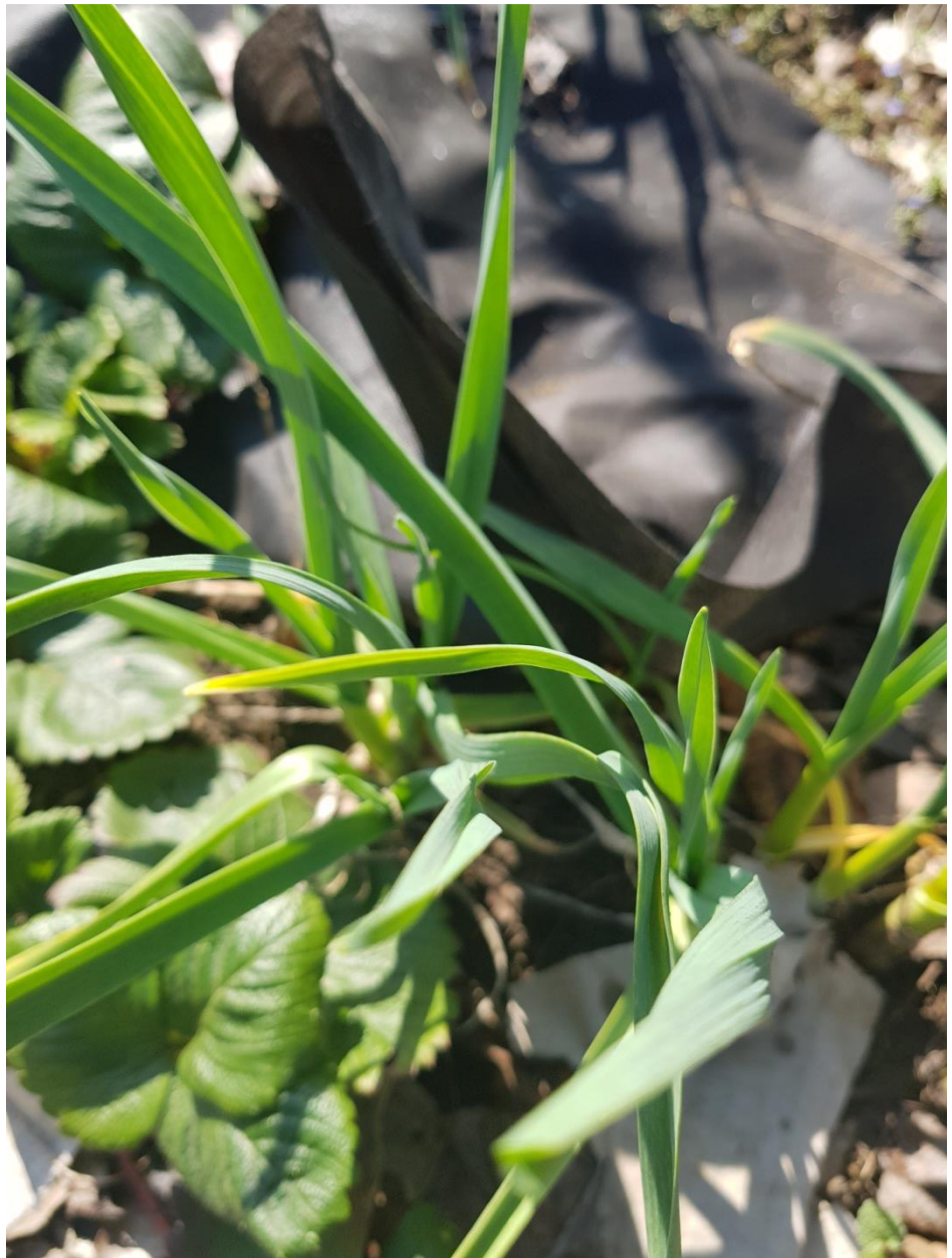
Черноплодная рябина и розы.