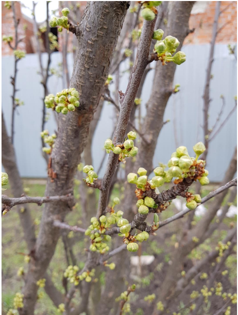
Облепиха. В прошлом сезоне было немного ягод, но деревце ещё маленькое